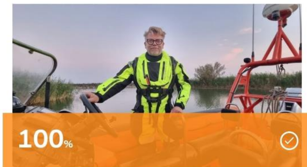
Crowdfundingactie Warm en Droog aan boord: streefbedrag is gehaald

Onze crowdfundingactie Warm en Droog aan boord is een groot succes geweest. Het streefbedrag van 9.000 euro voor 5 nieuwe overlevingspakken is gehaald.