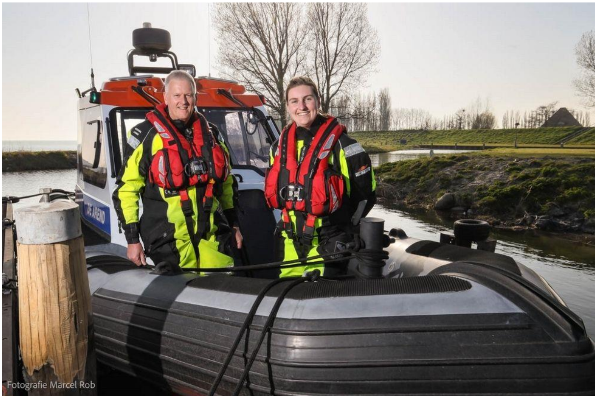
Onze nieuwe schipper rechts op de foto. Links de aftredende schipper welke als (plaatsvervangend) schipper dienst blijft doen bij het reddingstation.

Vanaf april 2022 is de operationele leiding van Reddingstation Wijdenes in handen van een vrouw. De eerste in Nederland en wij hebben de primeur en daar zijn we best trots op.