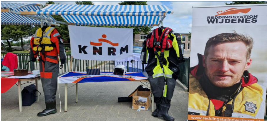
Stand op de verenigingsmarkt Wijdenes 9 juli 2022

Ook hebben we deelgenomen aan de Nationale Hulpverlenersdag in Hoorn en meegedaan aan de verenigingsmarkt in Wijdenes.